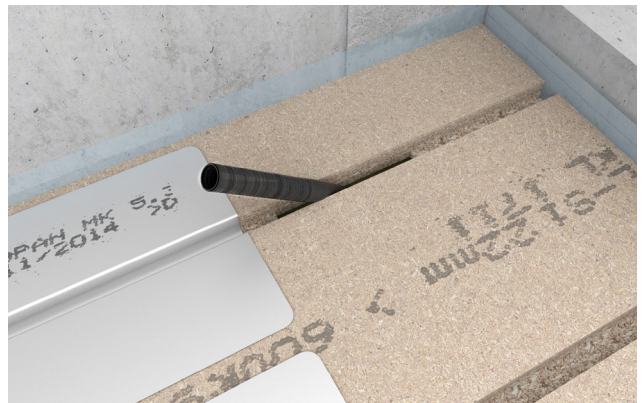
4. Gulvpladen placeres og monteres. Herefter trækkes tomrøret op gennem gulvpladen.