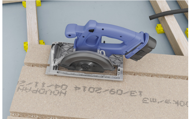
2. Med rundsav eller lignende skæres et hul på 15-20 cm i bunden af sporet på det sted hvor tomrøret skal komme op gennem gulvpladen.