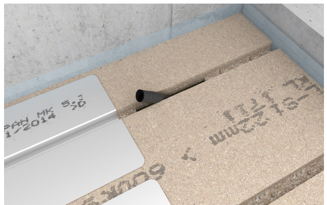
6. Kontrollér at tomrørets ende er i niveau med gulvpladen.