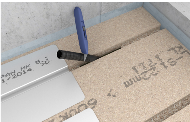
5. Den overskydende del af tomrøret skæres af.